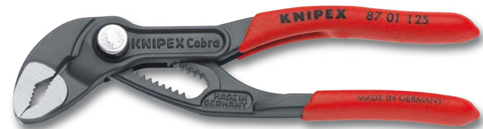
87 01 125 Рисунок 1:1